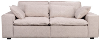
RAWLINS 3-SITSSOFFA B 226, D 116, H 85, SH 45

Europatillverkade 3-sitssoffan RAWLINS erbjuder en oemotståndlig komfort. De fyra dekorationskuddarna skapar en harmonisk balans mellan mjukhet och stöd, vilket ger dig möjlighet att koppla av i det generösa sittdjupet. Sofan finns i två modeller, 226 cm och 259 cm, klädd i slitstarkt material av hög kvalitet gör att du kan njuta av denna sköna soffa i många år framöver. Här nedan presenteras den lagerförda versionen av soffan i den beige textilen Bobby #2 som levereras på 1-2 veckor. Önskar du ett annat tyg/färg är leveranstiden 8-10 veckor och priser per tygkategori finns nedan. Alla tyger och färger presenteras på hemsidan www.rowicohome.com .