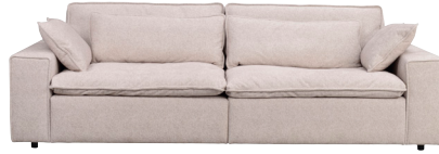
RAWLINS 3-SITSSOFFA MAXI B 259, D 116, H 85, SH 45

Lagerförd art.nr 122642 Bobby beige #2 (TK 2) 20 995:-